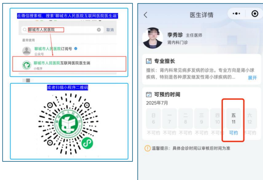
(图 1, 图 2)