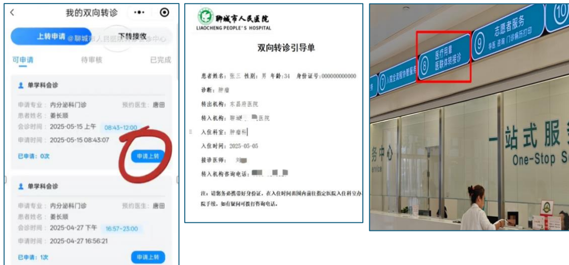
(图 3, 图 4, 图 5)

流程总结： 完成会诊 → 小程序申请上转 → 预约时间/床位 → 患者持引导单办理住院